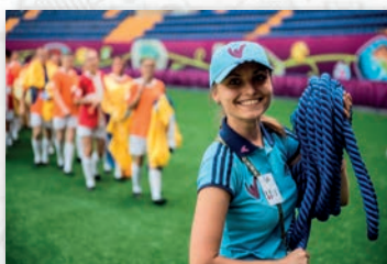
Informations et inscription sur :