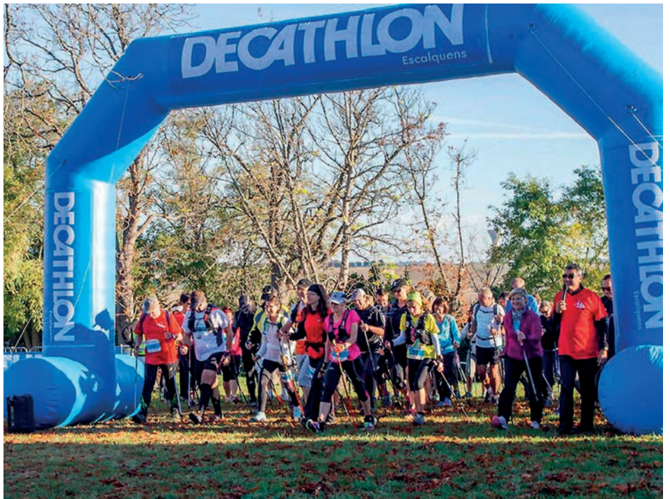
Départ de la Marche Nordique